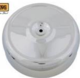
Capa Filtro Ar Classico Cromado Redondo Diametro 8" 29165-89 34-0548 VT R$539,76