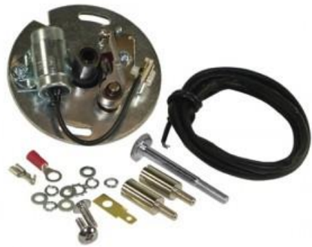
Kit Ignicao Platinado Condensador Mecanico com Avanco Roletado c/ Rolamento Agulha Harley 70-78 17597 R$706,37