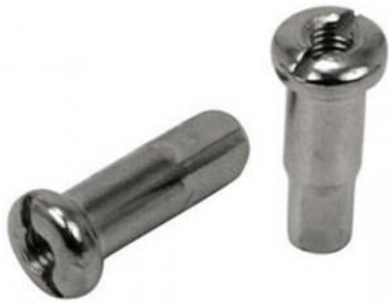
Kit Niples para Raios de Roda Raiada Harley 55020 Kit com 40 unidades MU R$238,18