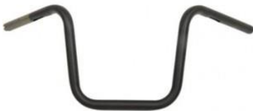
Guidao Preto 1 Harley Padrao Sportster Mini Seca 12 pol Altura VL R$435,00