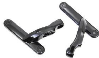
Par Suporte Preto Farol Auxiliar Seta Harley Touring 2014-2020 68000102 68000103 31-1343 VT R$1.561,88