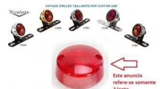
Lente Lanterna Reposicao para Mid-USA 11255 11257 11258 11259 11261 Harley 11710 R$65,82