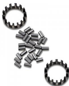
Kit Rolamento Roletes Direito Bloco Motor Virabrequim Harley Panhead Shovelhead 24650-58 A DS R$618,30