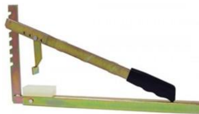
Ferramenta Portatil Para Troca de Pneu de Roda de Motocicleta Harley 57921 MU R$589,89