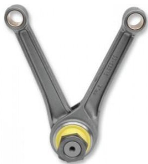
Kit Biela Motor Harley Panhead Shovelhead 1941-1973 24281-41 B DS-194660 R$3.945,87