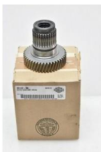
Engrenagem 6° Marcha Saida Caixa Harley 06-17 35122-06 R$1.090,00