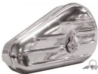
Caixa de Ferramentas Cromada Capa Estriada Estilo Anos 40/50 Lado Esquerdo Harley 64207-89 A 26211 R$779,07