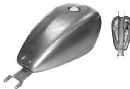
Replica Tanque Combustivel Harley 883 Iron XL 12L Injetada 07-20 90.20940089 LFParts R$1.934,16