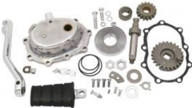
Kit Kick Start Pedal Partida Harley Caixa 4 Marchas Knucklehead Panhead Shovelhead 1936-84 33056-36 MU 71300 R$1.983,30