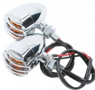
Par Setas Bullet Com Grelha Cromada Lampada de LED Amarela LFParts 90.20940020 Customização R$145,50