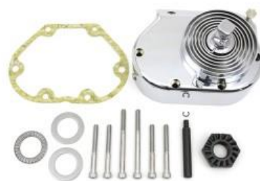
Kit Kick Start Pedal Partida Harley Evolution 87-99 e Twin Cam 88 00-06 Carburado 17-0858 VT R$5.278,76