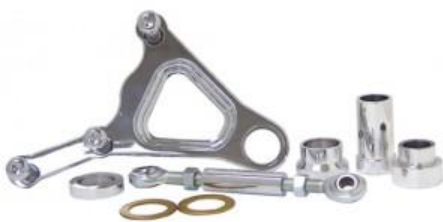
Suporte Cromado Pinça Freio para Frente Springer Lado Direito ou Esquerdo 58784 MU R$1.476,00

Esse folheto pode conter erros, a HDPECAS reserva o direito de corrigi-los - Preços válidos para produtos no estoque