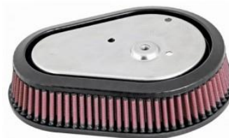
Filtro de Ar Lavavel Alta Vazao K&N Harley Harley Screaming Eagle 29385-08 84571 R$633,35