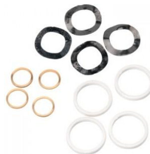
Arruelas de Pressao Espaçador Vedacao do Eixo Balancim Motor Harley Shovelhead 66-84 17452- 66 17450-73 11101 0927-0004 R$203,64