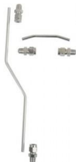
Tubo Linha de Passagem Oleo Motor Harley Shovelhead 1966- 1984 62783-66 62785-66 63527- 57 63529-57 DS-246010 R$225,99